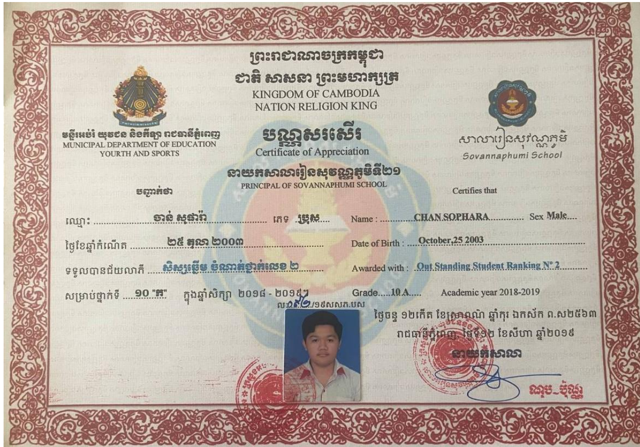
Outstanding award Grade 10