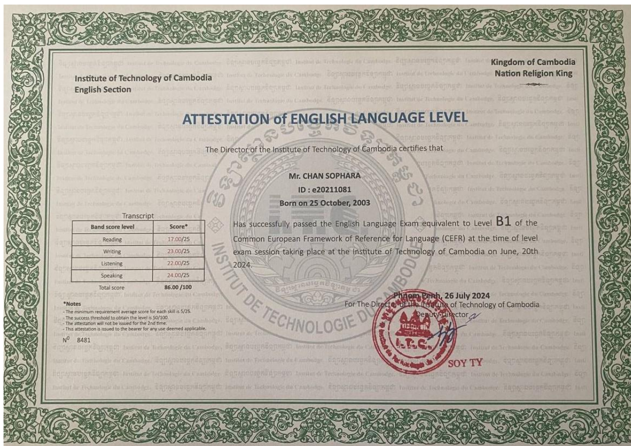
Attestation of English(B1) (Institute of Technology of Cambodia)