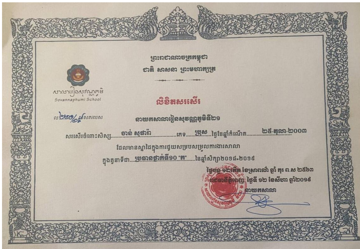
Class Monitor Award grade 10 (Sovannaphumi School)