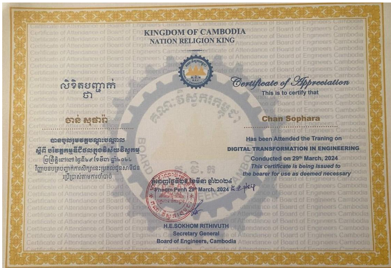
Participate in the Training on Digital Transformation in Engineering (CADT)