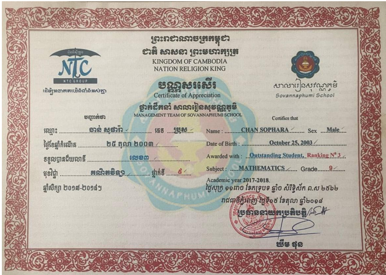
Mathematic Award Rank 3 grade 9 (NTC Group) (Sovannaphumi School)