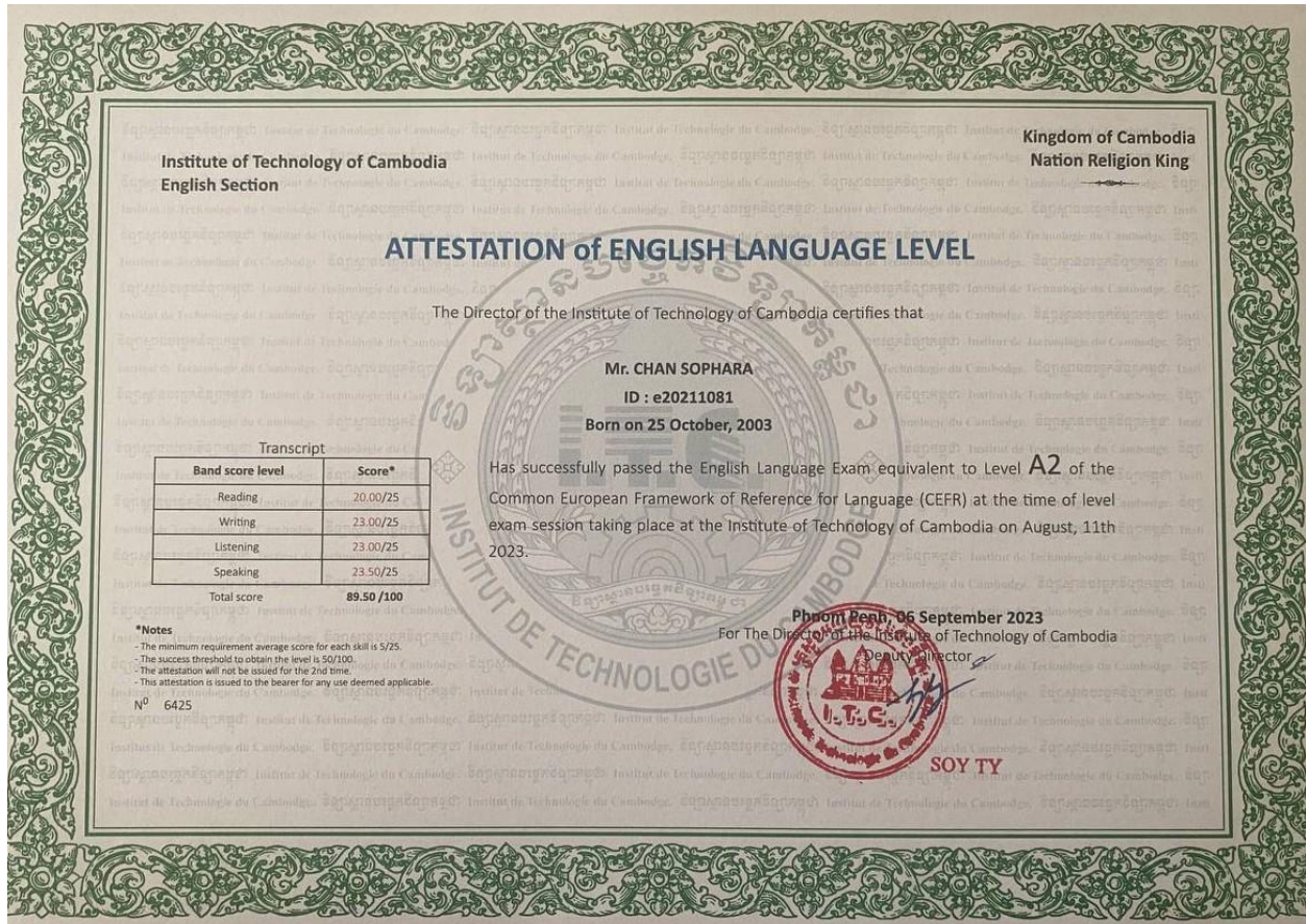
Attestation of English(A2) (Institute of Technology of Cambodia)